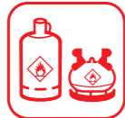
BOUTEILLES DE GAZ