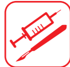
DÉCHETS D'ACTIVITÉS DE SOINS À RISQUES