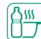
HUILES DE FRITURE