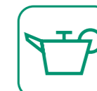
HUILES DE VIDANGE