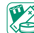
PILES ET ACCUMULATEURS