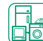
APPAREILS ÉLECTRIQUES ET ÉLECTRONIQUES

À déposer suivant les instructions du personnel