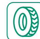
PNEUMATIQUES SANS JANTES