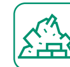
DÉBLAIS / GRAVATS